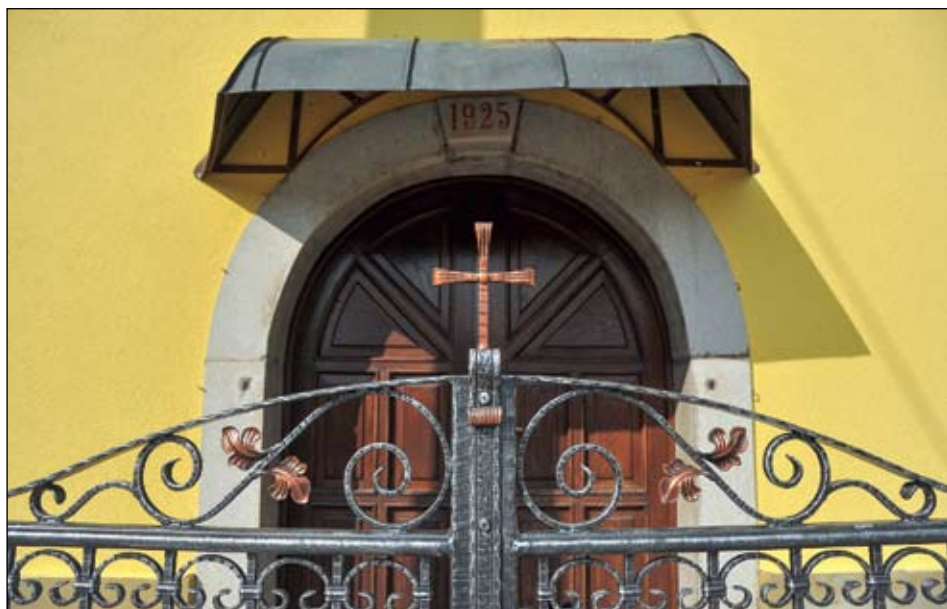
Detalj nove kovane ograde ispred Kapelice

U zapisničkoj knjizi bilježili su se revno i razni radovi: