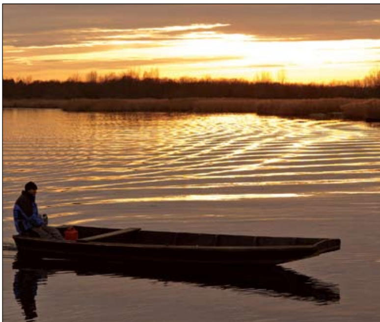
Vožnja dravskim čonom u 'smiraj'