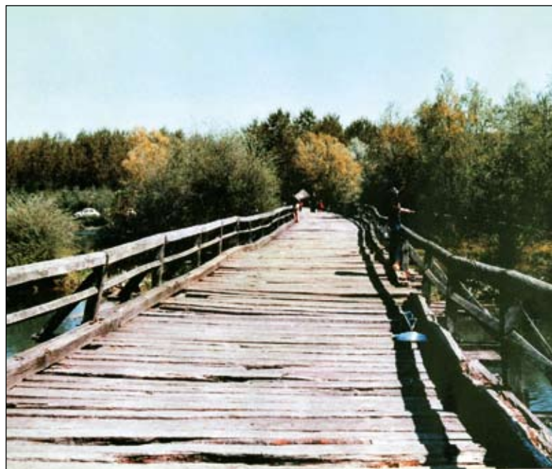
Stari drveni most kod Otoka