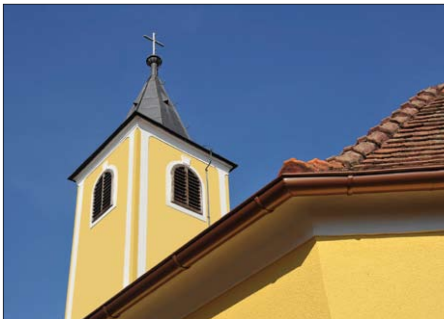
Toranj i krovšte kapelice Srca Isusova

Kako se u onom vremenu teško gradila kapelica u općini Otoku, a kada smo ju zgotovili, dobavili smo i zvona, ali u općini Otoku nije bilo meštra koji bi ga bil u turen spravil. Zabilježeni Hrastić Stjepan kovač iz Preloga se je odlučil i spravil ga je u turen, za svoju radnju nije zahtjeval ništa, nego si je zaželjel da u slučaju njegove smrti i pokopa, se zvonom javlja, iliti zvoni. Ovo je zabilježeno i prihvaćeno od sadašnjih žitelja, u Otoku dneva 30. maja 1934.