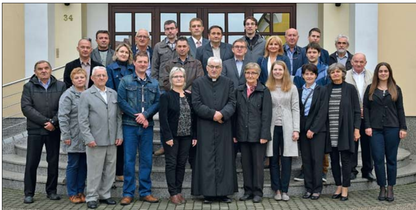
Članovi Župnog Pastoralnog vijeća župe Prelog