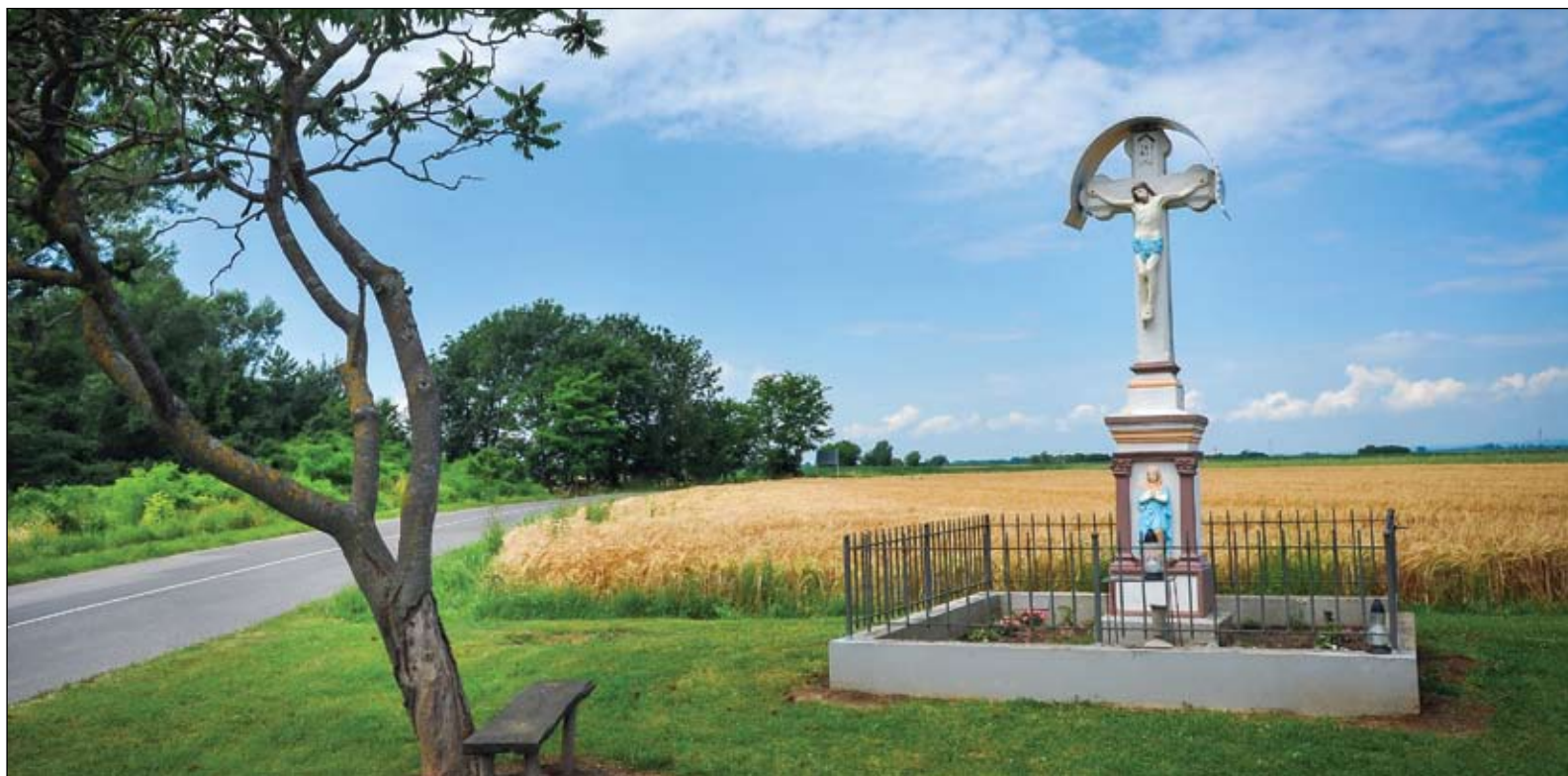
Pil na kraju Otoka, koji je do 1925. bio na mjestu današnje Kapelice