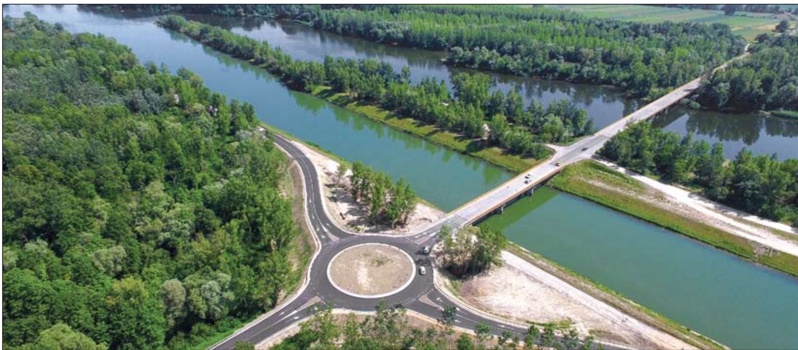
Novosagrađeni rotor kod mosta između Otoka i Hrženice