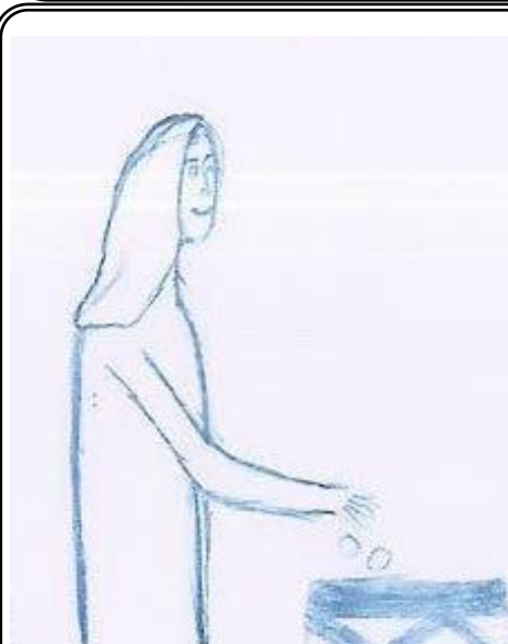
Tara Božek, 8.b

Ljudi čuvaju novac, takozvano bogatstvo u riznici. Ova udovica u riznicu je dala sve što je imala, iako je i nakon toga ostala siromašna. To je učinila u vjeri. Budimo kao ona; neka naša duša bude riznica gdje ćemo čuvati svoje bogatstvo - vjeru i ljubav prema Bogu.