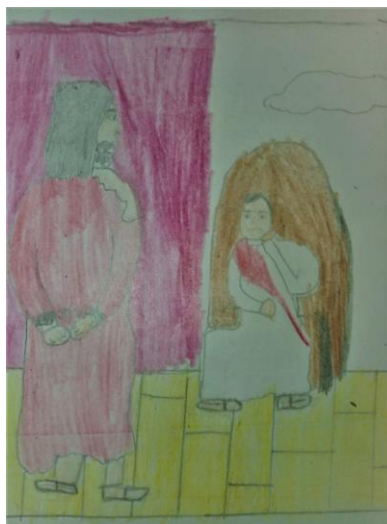
„Neduzni Isuse – oprosti nam!“