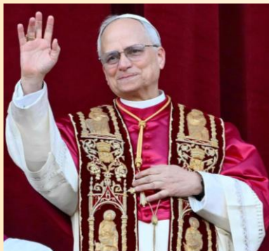
8. 5. 2025. na konklavama u Vatikanu izabran novi sveti otac – papa Lav XIV., američki kardinal Robert Francis Prevost

Ne možemo drugima dati ono što nismo primili. Isus, Božji Sin, uvjet je i mogućnost naše međusobne ljubavi i svake novosti koja započinje iskustvom ljubljenosti. Ne moramo mi smišljati kako ljubiti ni izmišljati što bi to ljubav bila. Onoliko koliko se otvaramo Očevoj ljubavi koja nas po Sinu dotiče snagom Duha Svetoga kušamo neizrecivu novost, i samo onoliko koliko dopuštamo, ne sebi, već toj ljubavi da u nama djeluje postajemo kadri živjeti ljubav i uživati obećanu novost koja nema zalaza.